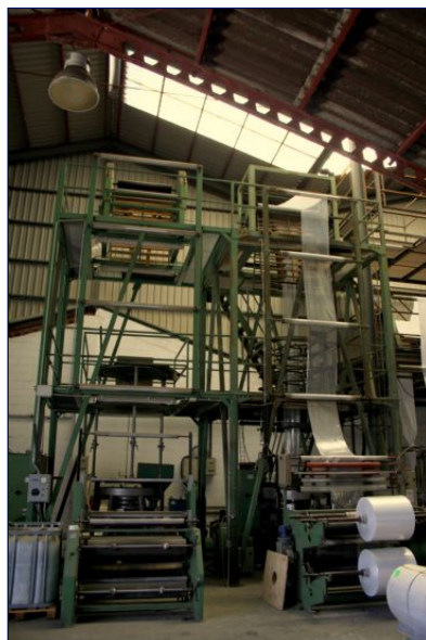
Línea de extrusión film 1200 mm