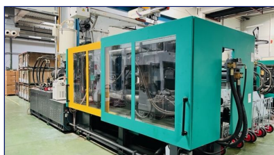
Inyectora termoplástico 460 ton Servo, con robot Ningbo Hengrun Plastic Machinery (Protecnos) Ref: ID-001