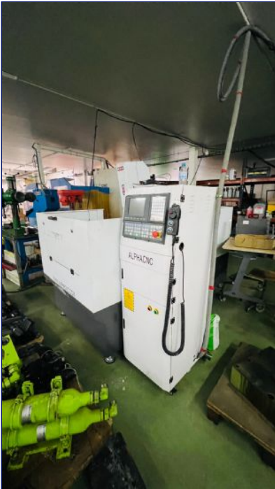
Mini fresadora para aluminio y madera CNC