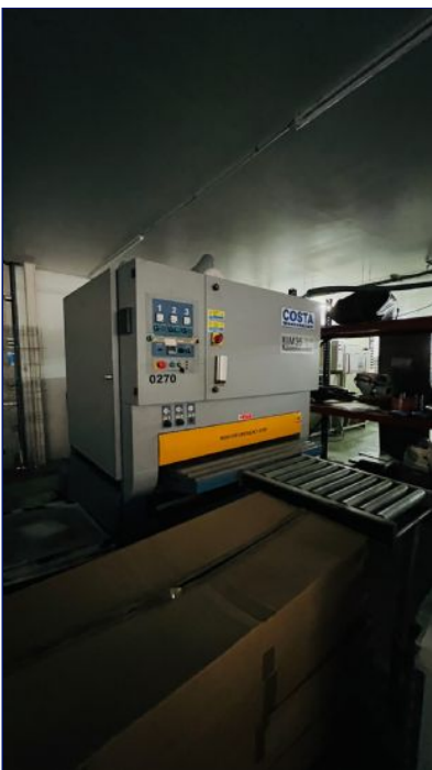
Lijadora calibradora 1150 mm COSTA M36 CCS 1150