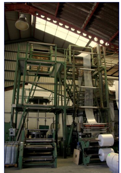
Línea de extrusión film 1600 mm