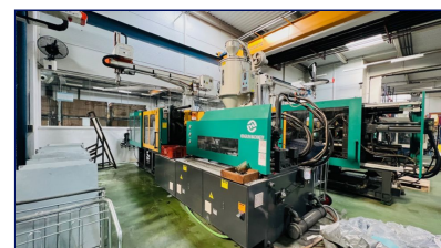
Inyectora termoplástico 360 ton Servo, con robot Ningbo Hengrun Plastic Machinery (Protecnos) Ref: CEM-043