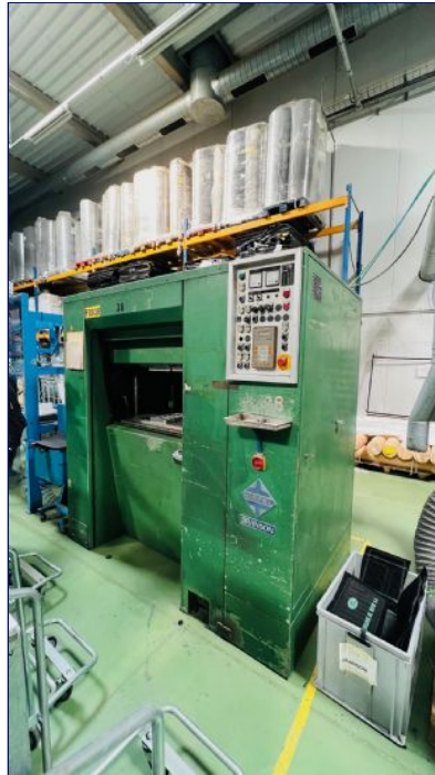
Soldadura ultrasonidos 10 Kva KIEFEL VIB ANLAGE 2700