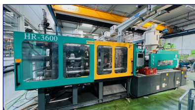
Inyectora termoplástico 360 ton Servo, con robot Ningbo Hengrun Plastic Machinery (Protecnos) Ref: CEM-044