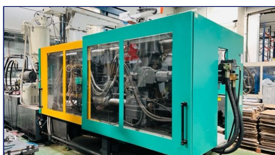
Inyectora termoplástico 460 ton Servo, con robot Ningbo Hengrun Plastic Machinery (Protecnos) Ref: ID-002