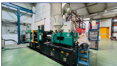
Inyectora termoplástico 200 ton. Servo Ningbo Hengrun Plastic Machinery (Protecnos) Ref: CEM-045

Enviamos nuestra Newsletter de Febrero con 21 máquinas de sector inyección, extrusión, metal y periféricos con entrega inmediata prácticamente de todas las máquinas. Para más detalles o para visita de inspección de estas máquinas, pueden llamar al teléfono 936664932, contactar a través de WhatsApp 690 216 107 o bien enviar un correo a info@cemausa.com . Pueden hacer sus compras en la web o bien solicitar factura proforma directamente.