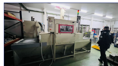
Chorreadora arena automática con filtro AYMSA SBF-2 Ref: CEM-047