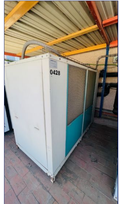
Grupo refrigeración agua 112.000 frigorías /horas